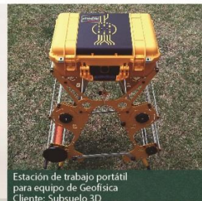
Estación de trabajo portátil para equipo de Geofísica Cliente: Subsuelo 3D