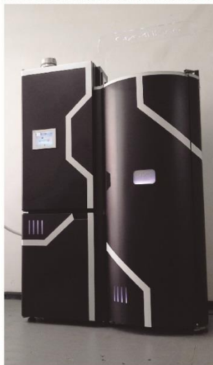
Cabina de Crioterapia Cliente: QW Health para su marca Cry4Life