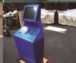
Punto de control para transportadores de carga Cliente: Destino Seguro