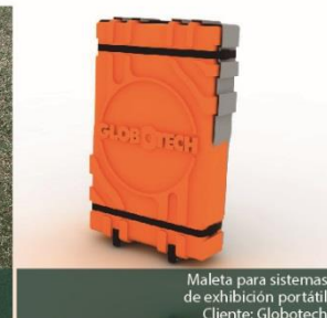
Maleta para sistemas de exhibición portátil Cliente: Globotech